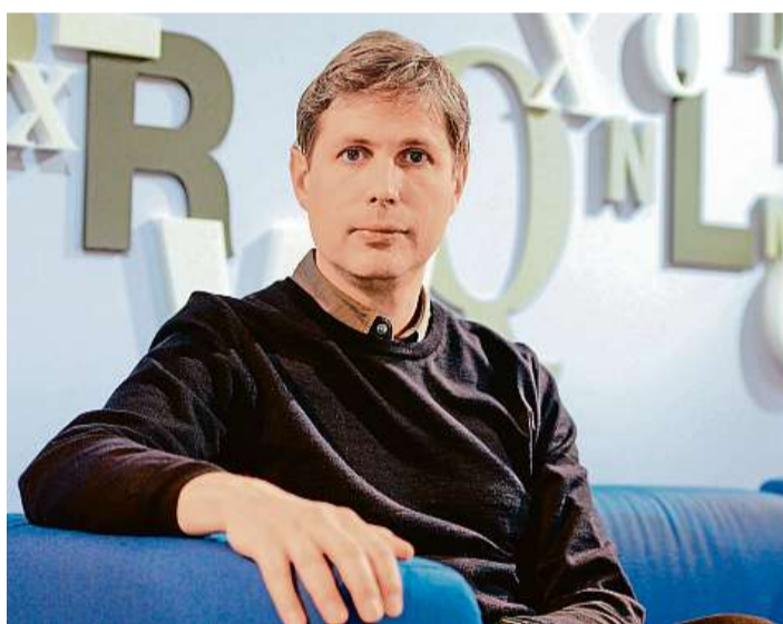
Vyčaroval parádní příběh Daniel Kehlmann v románu Tyll po svém oživil postavu legendárního šprýmaře.

Nechal jeho šibalství čelit narázům vražedné bestiality, konkrétní rozum bojovat s obecným nerozumem. Ostatně má to svou logiku: Enšpígl totiž ve svém příjmení sklá-